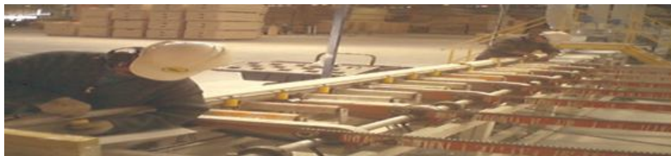
SERVICIO DE MONTAJE